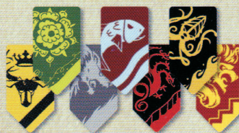
7 Pions Blason