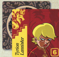
6 Cartes Personnage Maison Lannister