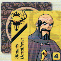
4 Cartes Personnage Maison Baratheon