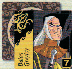
7 Cartes Personnage Maison Greyjoy