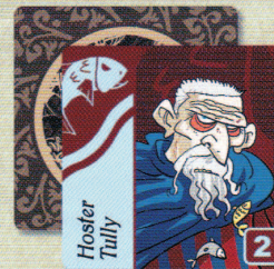
2 Cartes Personnage Maison Tully