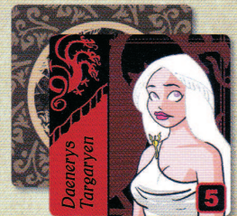
5 Cartes Personnage Maison Targaryen