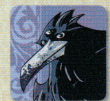
4 Pions Corneille à Trois Yeux