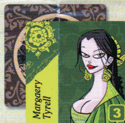
3 Cartes Personnage Maison Tyrell