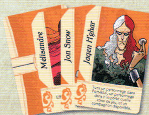
14 Cartes Compagnon