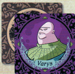
1 Carte Varys